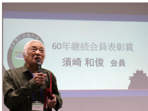
記念式典（2017年）での受賞スピーチ風景